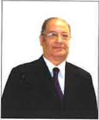
Writer - Ali Fausi

تشكلت فعاليات معرض 4 × 1 من مجموعة من التجارب والخبرات الفنية الجديدة التي تركز على مبدأ التجريب في الأسلوب والتقنية للفن العراقي لمجموعة من الفنانين العراقيين المقيمين في الدوحة وهؤلاء هم: