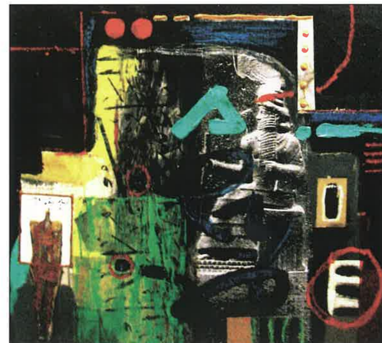
Details Artist - Ziad Bakury 2008