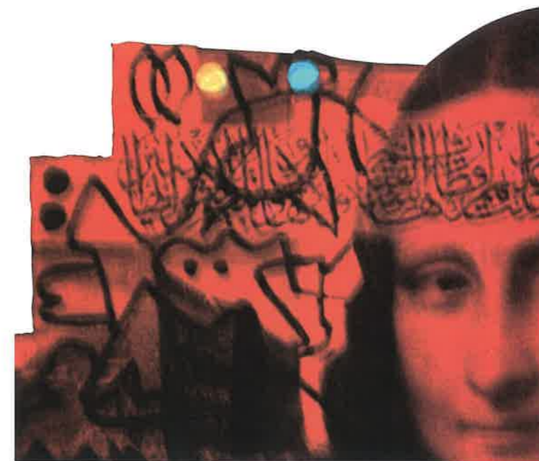
Details Artist - Ziad Bakury 2008

حيث يكمن قصدي في تناول هذه الذاكرة الفنية التشكيلية بكل تفاصيلها في المضمون والشكل واللون للمشاهد، يكمن في ايصال هذا الطابع البغدادي المتميز بروية فنية جديدة فكرة ومضمونا تحمل معارفي وخزني الثقافي والفنية والأكاديمية. فالمدرسة البغدادية عاشت عصرها الذهبي في سنوات الستينات والسبعينات من القرن الماضي، عندما كانت العاصمة بغداد هي ملتقى الفن التشكيلي العربي وأحدى رائدات الفن التشكيلي العالمي في ما كان من معارض تحمل اساليب فنية ومفاهيم تشكيلية اصيلة ومبتكرة، ناهيك عن الكم المتميز من الندوات والمهرجانات والمعارض الأدبية والثقافية الرصينة، والله ولي التوفيق